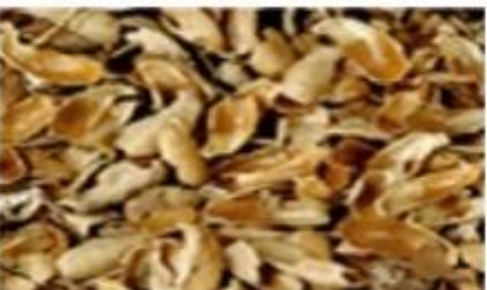
Castor Seed Shells